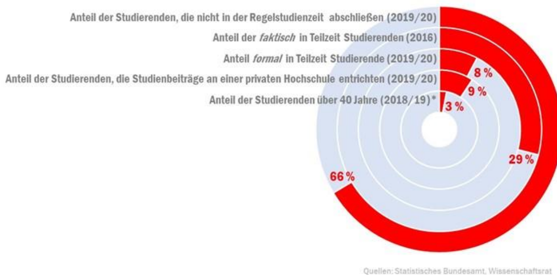
Abbildung 2: Anteile der Studierenden nach Gruppen, bei denen das BAföG derzeit nicht greift. 2

Studienform 1) , Regelstudienzeit (halten 66 % nicht ein), Studiengebühren an privaten Hochschulen (betrifft ca. 9 % der Studierenden, wird aber im Inland beim BAföG, anders als beim Auslands-BAföG, nicht mitgedacht) bietet das BAföG mit einer traditionellen Normvorstellung der Studierenden und eines Studiums Antworten von gestern auf die Fragen von heute. Innovative Studienformen wie Orientierungsangebote, weiterbildende Masterstudiengänge und boomende Zertifikatsstudiengänge passen nicht in die BAföG-Welt. Starre Altersgrenzen nehmen zu wenig Rücksicht auf sich immer mehr ausdifferenzierende Bildungsbiografien.